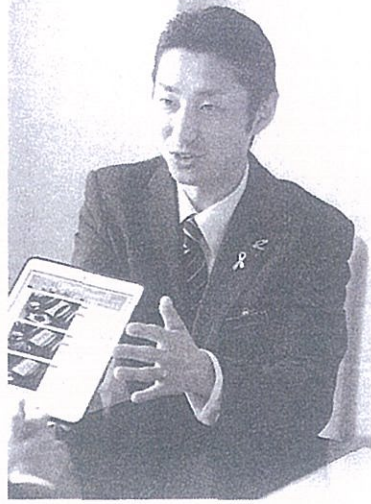
清月記は事前相談などの対応を強化するため、タブレット約50台を導入した

生前に葬儀や墓の準備をする「終活」が広がっているを受け、東北の企業が次々と新たなサービスを始めている。葬祭会社は社員にタブレット端末を持たせ、葬儀の相談に来る人に画像を見せて対応。霊園は墓を継ぐ人がいなくなっても一定の期間、墓を管理するサービスを始めた。自然の中に葬ってもらいたいという要望に応える企業も登場している。