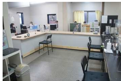
管理事務所窓口リニューアル