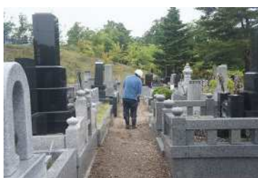
地割れ箇所締固め転圧