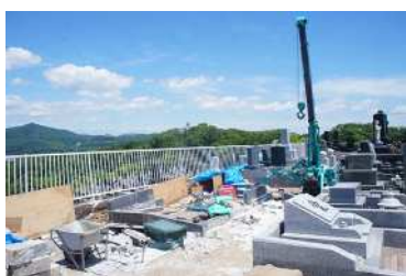
擁壁付近墓石取外し