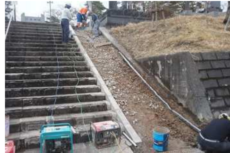
7区階段脇スロープ改修