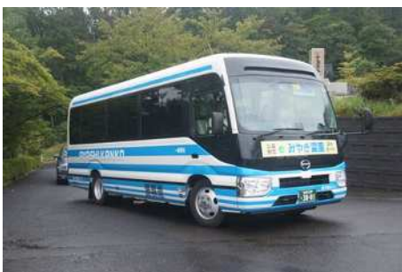
繁忙期仙台駅往復シャトルバス