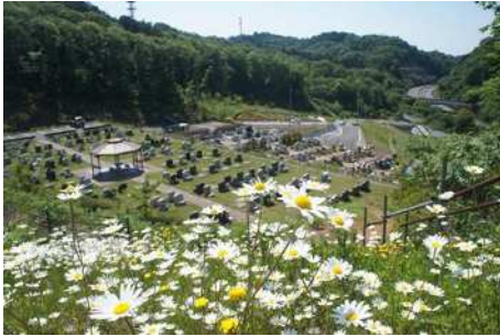
オックスアイデージー